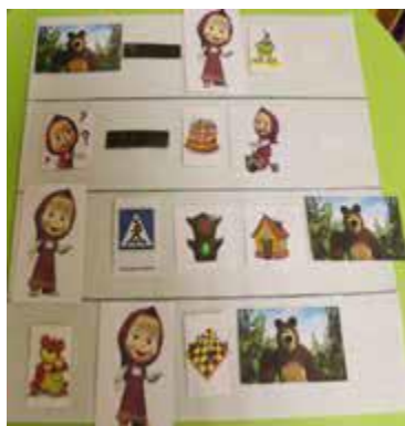
Рис. Мнемотаблицы по безопасному поведению на дорогах

Теперь попробуем научиться составлять мнемотаблицы для описания автомобилей (рис.).