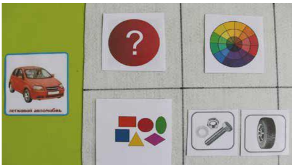
Рис.. Мнемотаблица для описания автомобиля

– Ваши дети любят мультфильмы? А мультфильм «Маша и медведь»? Предлагаю придумать сказку про день рождения медведя, используя мнемотаблицы.