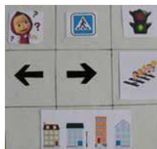
Рис. Мнемодорожки по безопасному поведению на дорогах

– Молодцы. Все справились с заданием. А теперь, чтоб немного отдохнуть, давайте проведем флэшмоб. (Звучит песня «Светофор»)